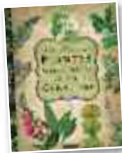
Liburua "Atlas ilustrado de..."