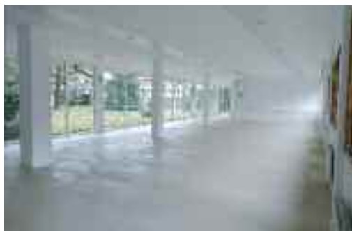
Topalekua. Taberna ondoko gune komuna (altzariak falta dira). Klaustrora irteera dauka.

Proiektua borobiltzeko Eltzia eraikineko fatxada osoa hartuko duen mural erraldoi bat margotuko dute, barruan dagoen dinamikaren erakusle izango dena. Horrekin batera, ate irekien eguna antolatuko du udalak, herri osoak ikusi ahal izan dezan zer den Eltzia.