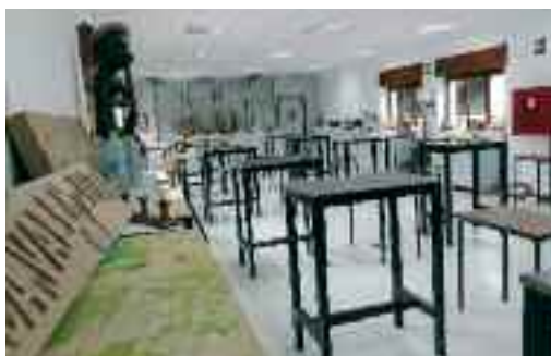
Zizelkariak. Taila taldekoen tailerra.