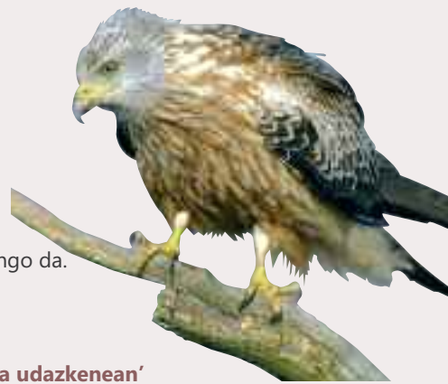
Argk.: Xabier Mendarte