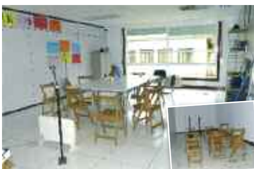
Bertso Eskola koen bilera eta entsegu gela.