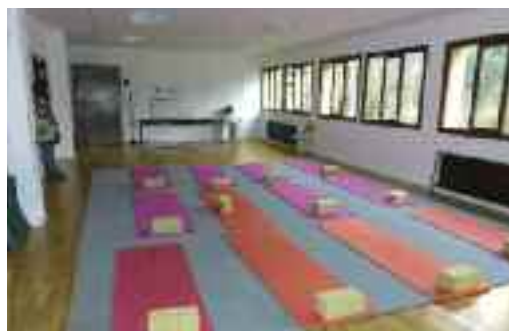
Yoga. Lagun Leku elkartearen yoga taldearen lokala