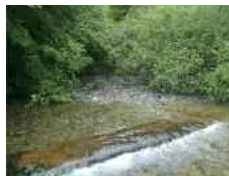
Zirauntza hibaiaren iturburu ikusteko aukera egongo da

Aloña Mendik hile honetarako antolatu duen ibilaldia Altzaniako mendikatean barrena izango da. Otzaurten abiatu eta lehen zatia baso artean egin ostean, Aratz inguruko karstera atera eta Allaitz (1245 m.) tontorrera igoko dute. Jeitsieran Zirauntza hibaiaren iturburu ikusgarritik pasako dira. Luzeera, 16 km (700m.-ko desnibela) 5 orduetan egiteko modukoa, zailtasun barik. Irteera, goizeko 8:00etan Postetxe parean. Izena emateko epea: otsailak 15, Aloña tabernan, edo alonia-mendi.mendi@gmail.com helbidean. Prezioa: 10€. Federatuta egon behar da.