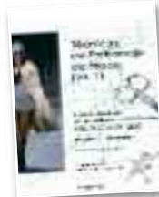
Liburua "Técnicas de patronaje..."