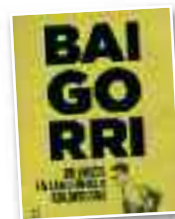
Liburua "Baigorri. Un vasco en..."