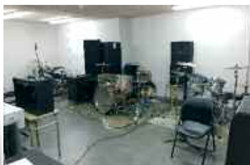
Musika eltzia. Musika taldeentzako lokaletako bat.