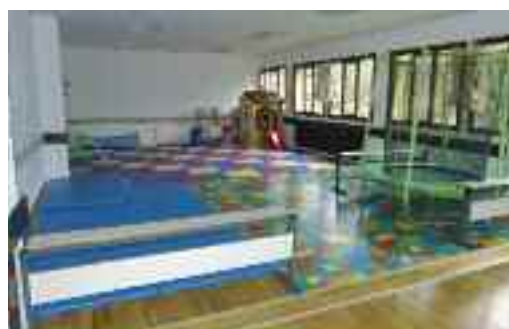
Familia gunea. Txantxiki familia elkarteak haurrekin egoteko daukan txokoa.