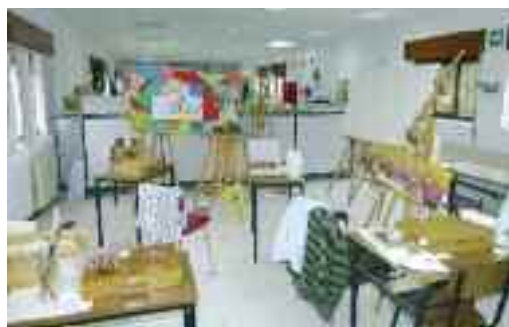
Pintura taldearen gunea.