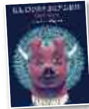
Komikia "El dios dinero"