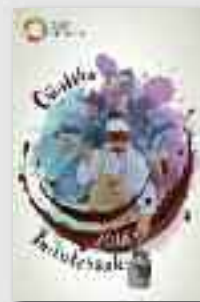
Otsailaren 10ean ospatuko da aurten Oñatiko inauteria

Urtez urte garatuz eta osatuz joan da eta hasieran markatutako hainbat helburu ere lortu ditugu, eta horrek poza ematen du. Musika eta dantza errepertorio propioak garatu ditugu, inauteriaren esanahia isladatu nahian aurrerapausuak eman dira, herriko talde edo eragile ezberdinekin elkarlanean