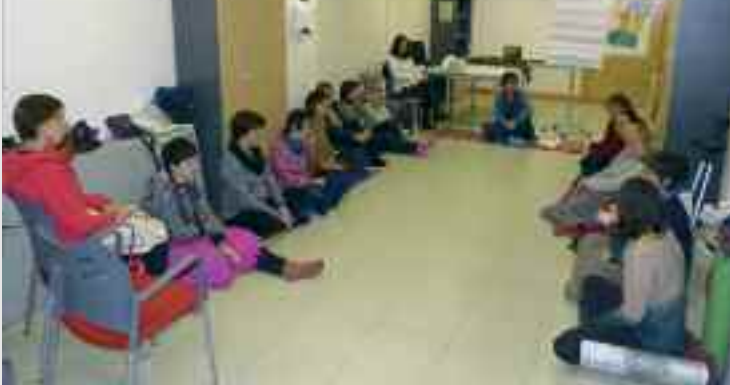
Osasun eta oreka emozionala lantzeko Mindfulness tailerreko irudia.

Urtarrilaren 8an jarri zen abian udaleko Berdintasun sailak antolatu duen Emakumeentzako Jabetze Eskola. Herriko emakumeen topagune eta gogoeta nahiz prestakuntzarako gune izan nahi duen foro honetan hainbat ekitaldi (tailerrak, hitzaldiak...) egingo dira ekaina bitartean. Lehenengo bi tailerrek ( Mindfulness eta Batukada ) oso erantzun ona izan dute. Hurrengo ikastaroak hauek dira: 'Nolakoa da gure parte hartze sozial eta politikoa?' ; 'Autodefentsa feminista' ; 'Brikolaje tailerra' ; 'Menopausia eta sexualitatea' ; 'Gure buruaren jabe' . Informazioa eta izen-ematea, udaleko Berdintasun sailean (943780411).