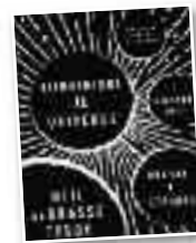
Liburua "Bienvenidos al universo"