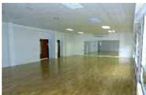
Oñatz dantza taldearen lokaletako bat. Gorputz Eltziako lokal guztietan egurrezko zorua jarri da