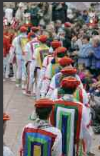
Ituren-Zubieta, Lesaka, Luzaide eta Lantzeko inauterietako irudiak.