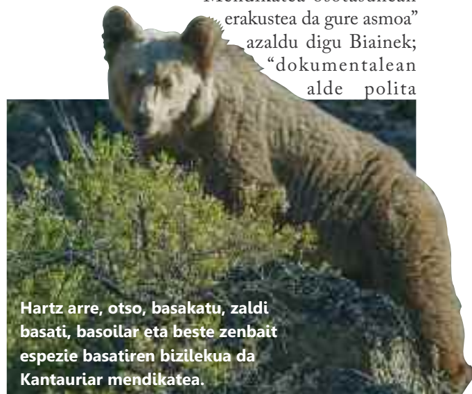
Hartz arre, otso, basakatu, zaldi basati, basoilar eta beste zenbait espezie basatiren bizilekua da Kantauriar mendikatea.

“Mendikatea osotasunean erakustea da gure asmoa” azaldu digu Biainek; “dokumentalean alde polita