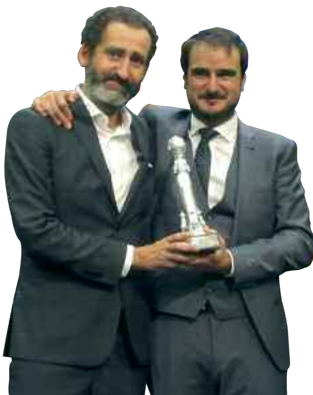
Donostiako zinemaldian epaimahaiaren sari berezia jaso zuen Handia filmak

produkzio bat ( Nur eta Heren-sugearen tenplua ) animazioko film onenaren sarirako izendatuta dagoela, eta laster, genero fantastikoko pelikula bat ( Errementari ) estreinatuko dela. Horrek erakusten du kalitatea eta barietatea dagoela euskal zinemagintzan.